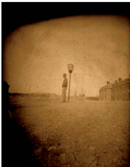
Frédérique Riba Sarat. Solitude urbaine, 2004