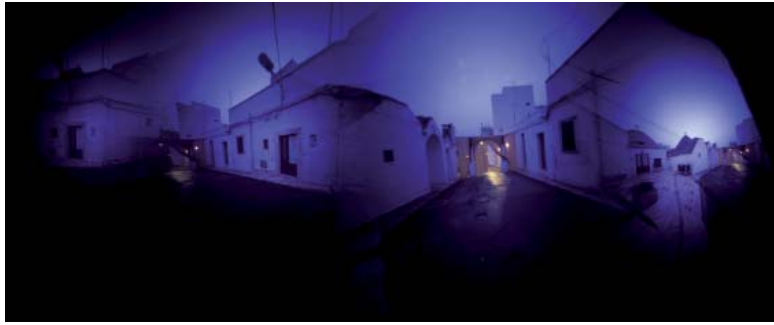
Bastien Defives. Série «Fuites», 2008

La série «Fuites» est un travail photographique en sténopé panoramique développé pour le spectacle «lik»i (danse - photo - musique spatialisée) du collectif PuIX.