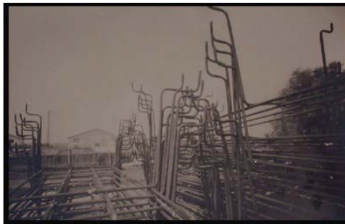
Fabrice Lassort. Positif direct, été 2008

Fabrice Lassort est un spécialiste des procédés anciens. A l'ère du numérique il traduit une volonté d'être acteur de sa propre production photographique, il fabrique ses appareils : cartophotes, sténopés, mais aussi ses chimies avec la cyanotypie, le papier salé ou la ferrotypie. Ses recherches nous interrogent sur l'identité d'un photographe: l'utilisation d'appareil qui oblige à un autre regard, ces chimies qui nous transposent dans un monde révolu, avec une façon d'opérer quasi physique. Il nous rappelle les expéditions des photographes explorateurs, laborieuses et glorieuses. La démarche de Fabrice Lassort interroge et replace la question de la photographie d'art dans la normalisation du langage photographique. C'est un artiste atypique qui nous ouvre les portes de rituels magiques où l'expérience de l'image se renouvelle à chaque fois.